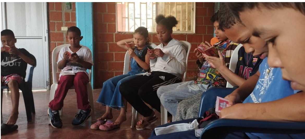
Fotografía tomada en los encuentros de niñez en la Honda comuna 3

La Corporación Educativa Combos, dentro de sus creaciones pedagógicas construyó a través de las magias de los niños y las niñas que ha acompañado durante casi tres décadas; el Álbum de Brujas Duendes Y Hadas, un material pedagógico en el que habitan diferentes seres especiales, cuyos nombres obedecen a las fuerzas internas que poseen y que no son ajenas a nuestra naturaleza humana.